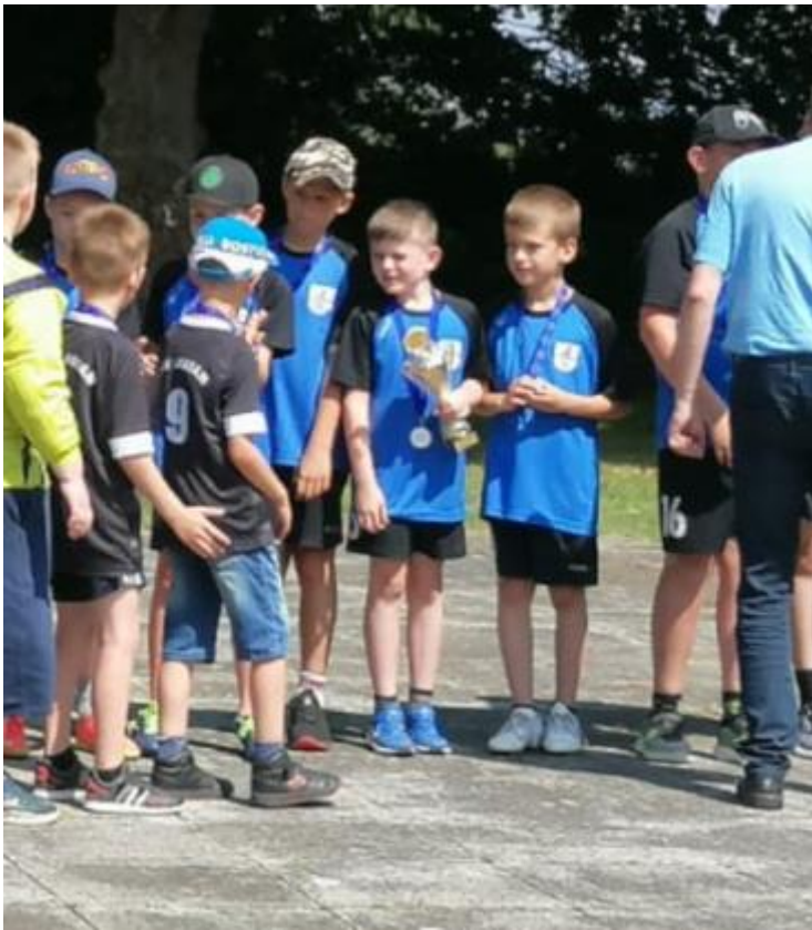
Siegerehrung 01.06.2024 / Ceremonia wręczenia nagród 01.06.2024