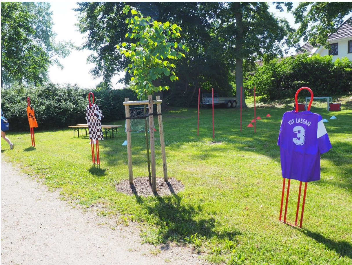
Festwiese 01.06.2024 / Festiwalowa łąka 01.06.2024