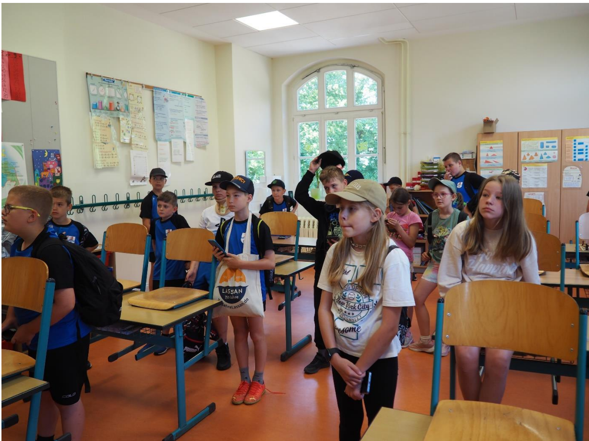
Kennenlernen der Stadt Lössan 01.06.2024 – sanierte Grundschule / Poznawanie miasta Lössan 01.06.2024 – Wyremontowana szkoła podstawowa