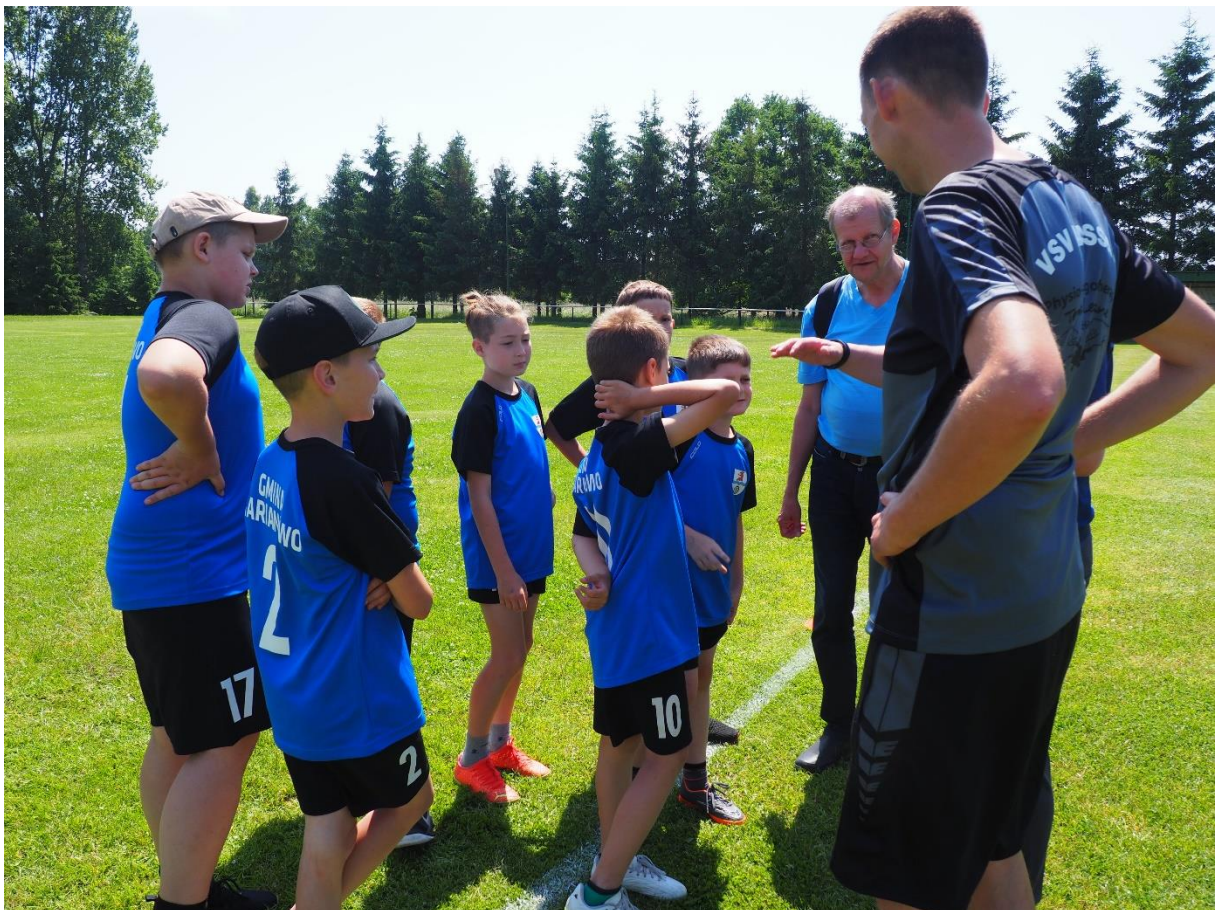
Spielbesprechung mit den Schiedsrichtern 01.06.2024 / Odprawa meczowa z sędziami 01.06.2024