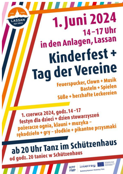
Plakat der Veranstaltung/ Wydarzenie plakatowe