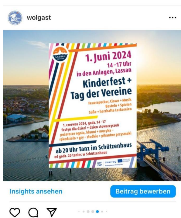
Werbung auf Instagram / Reklama w serwisie Instagram