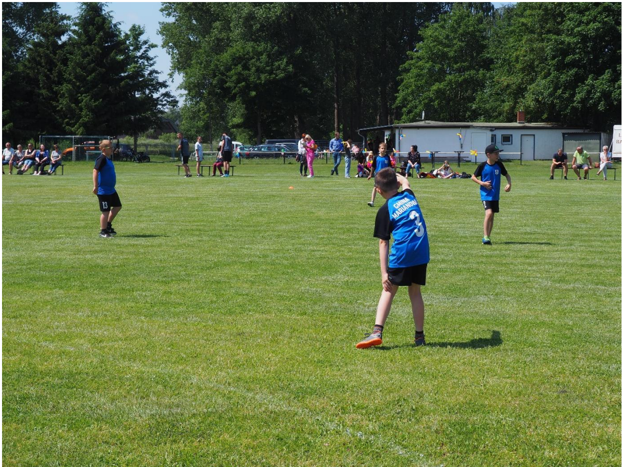
Gemeinsames Spiel zwischen Marianowo und Lassan 01.06.2024 / Wspólny mecz Marianowo i Lassan 01.06.2024