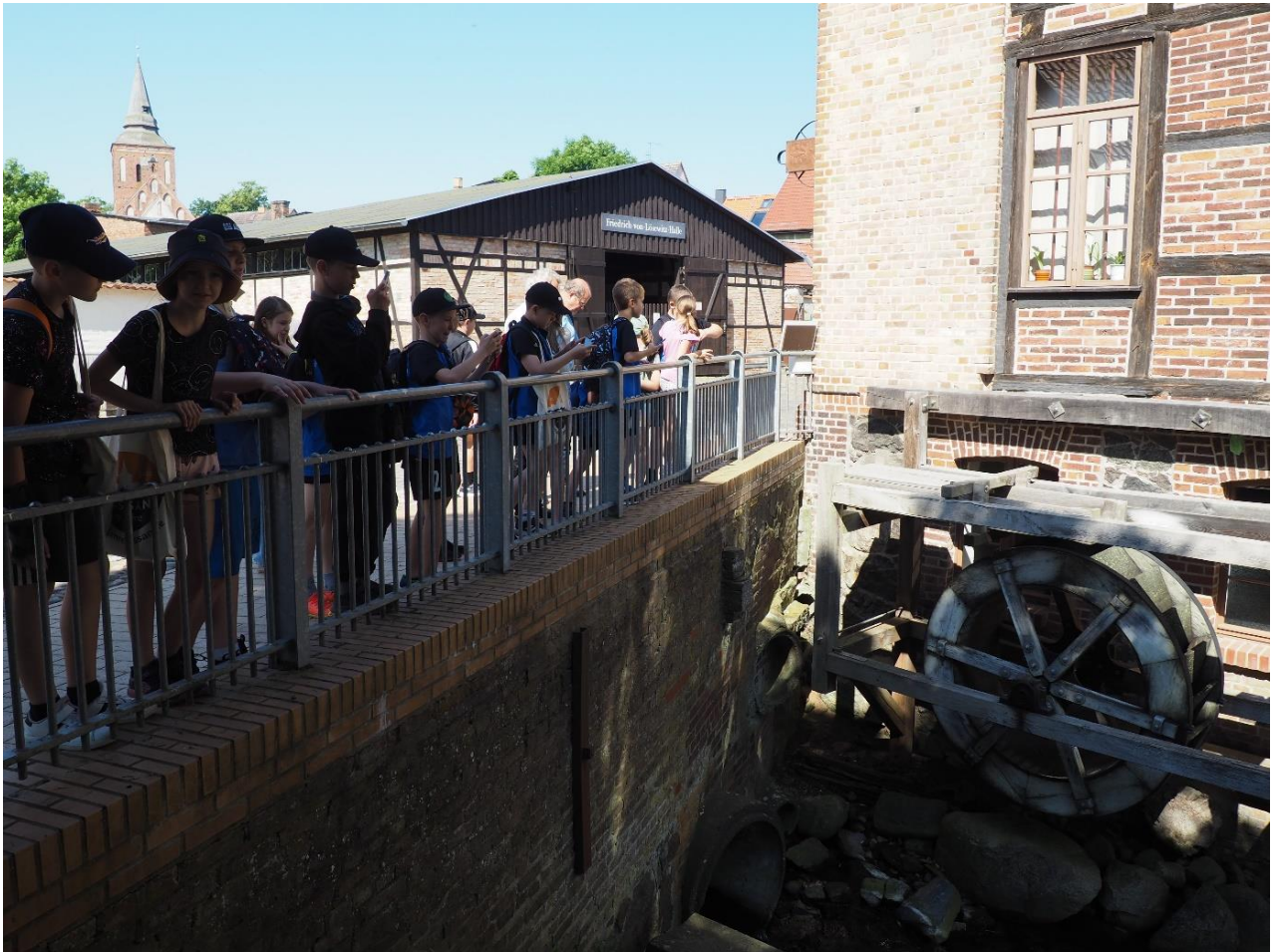
Kennenlernen der Stadt Lössan 01.06.2024 – Wassermühle / Poznawanie miasta Lössan 01.06.2024 – Młyn wodny