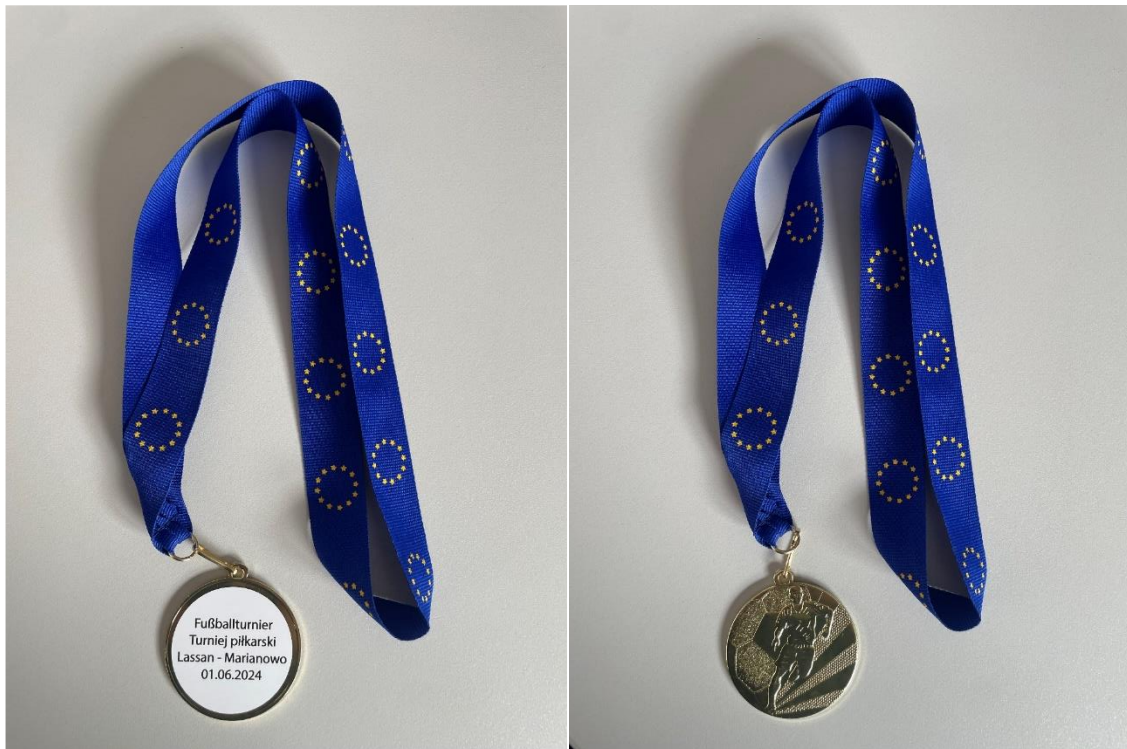
Medaillen / Medale