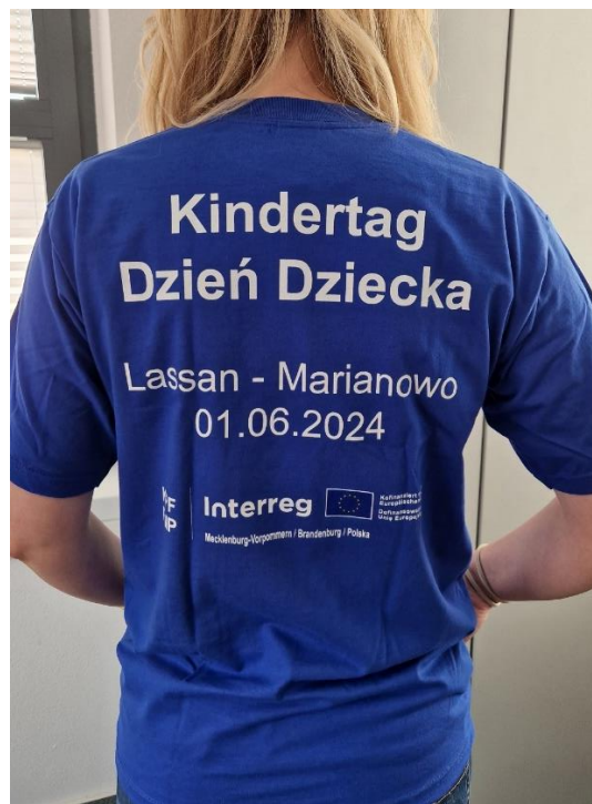
Aktionstags-Shirts für Groß und Klein / Koszulki dla młodszych i starszych