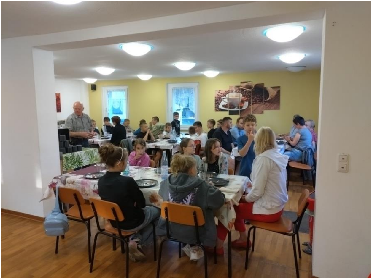
Gemeinsames Abendessen 31.05.2024 / Wspólna kolacja 31.05.2024