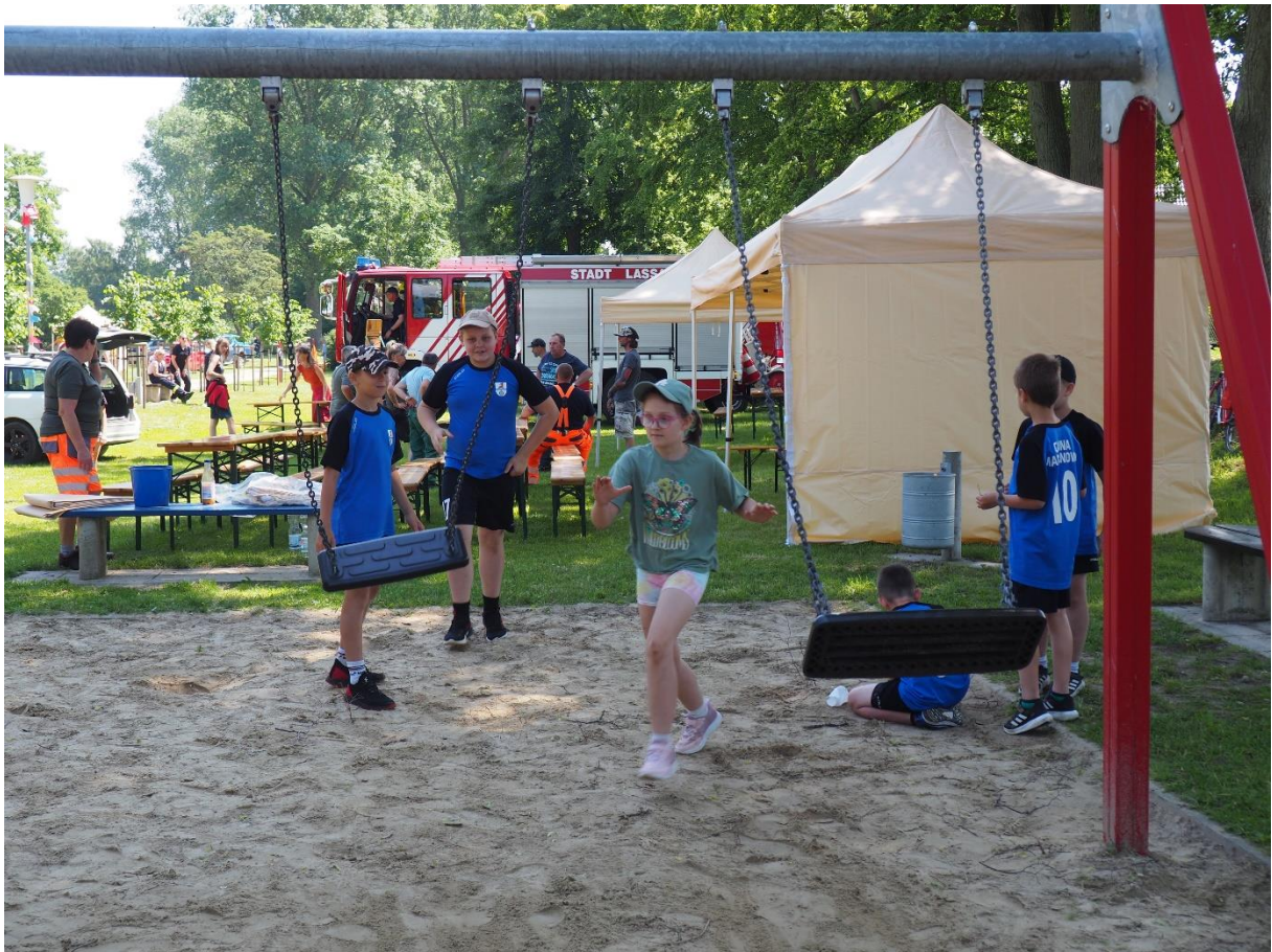
Gemeinsames Spielen 01.06.2024 / Wspólna gra 01.06.2024