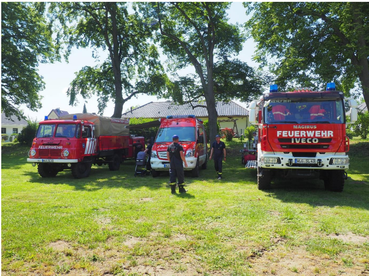
Programmgestaltung – Feuerwehr 01.06.2024 / Projekt programu - Straż pożarna 01.06.2024