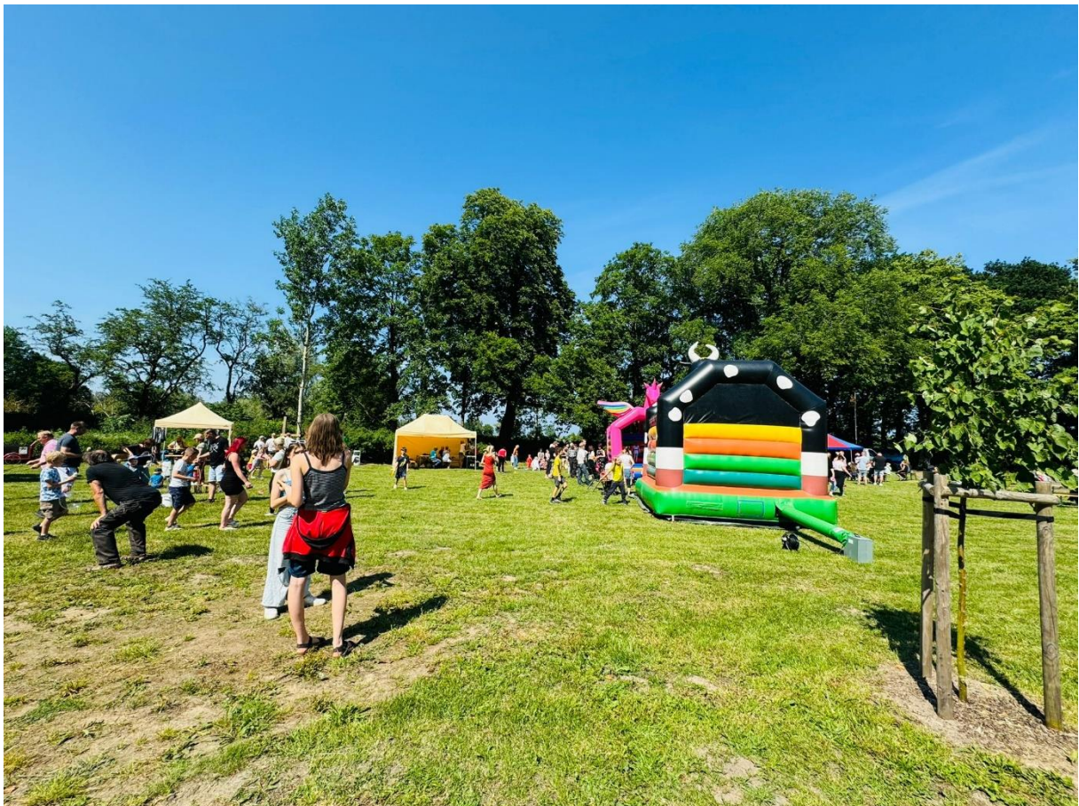
Gemeinsames Spielen 01.06.2024 / Wspólna gra 01.06.2024