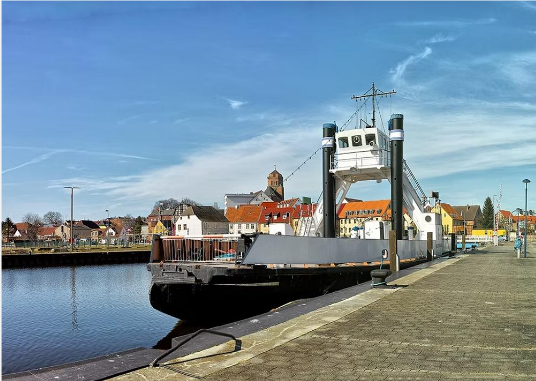
Außenansicht der "STRALSUND" im Stadthafen Wolgast