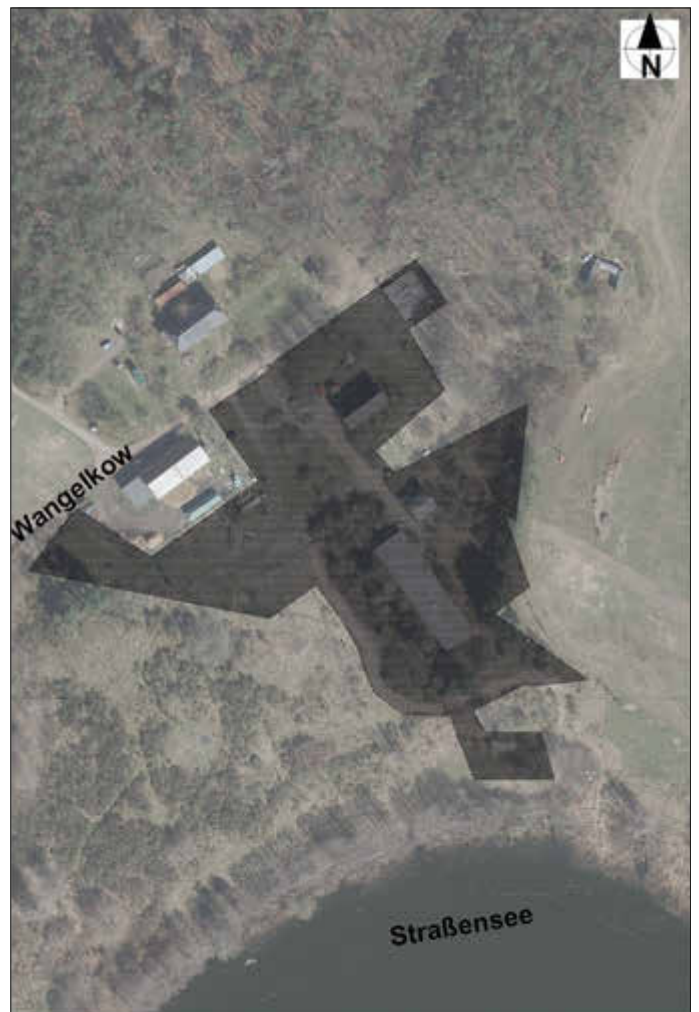
BP Nr. 2 „Ferienlager Wangelkow - nördlich des Straßensees“ OT Wangelkow