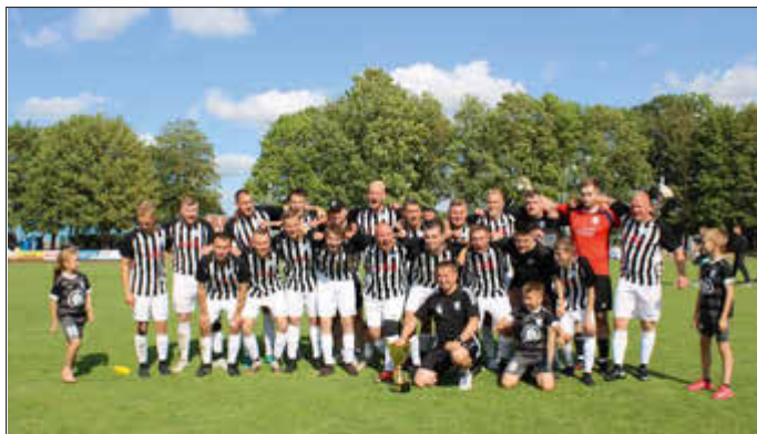
Ausgelassene Stimmung nach dem Pokalgewinn

Den krönenden Abschluss einer außergewöhnlichen Saison bildete das Finale um den Lübzer Kreispokal am 5. Juli im Gützkower Jahnstadion. Gegen den klassenhöheren SV Murchin/Rubkow zeigte der VSV eine starke Leistung und setzte sich in einem torreichen Endspiel verdient mit 5:3 durch. Mit einer engagierten Mannschaftsleistung und großer Offensivstärke gelang die Überraschung gegen den Favoriten.