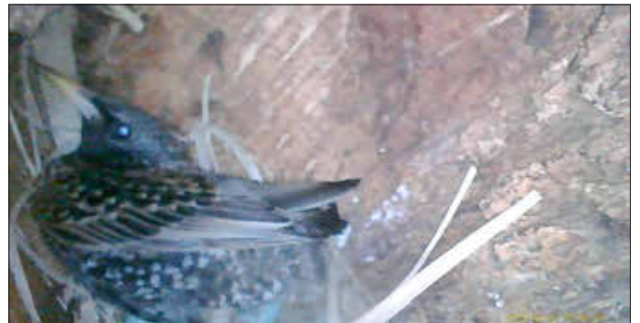
Aufnahmen vom Inneren der Baumhöhlen werden mit einem Endoskop gemacht.

Die regelmäßige Kontrolle der Bäume im Stadtgebiet dient nicht nur der Verkehrssicherheit, sondern leistet zugleich einen wichtigen Beitrag zum Natur und Artenschutz.