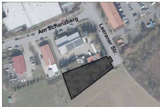
Übersichtsplan BP Nr. 43 „am Schanzberg I - westlich der Leeraner Str.“