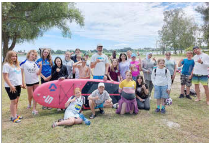
Gruppenbild Wolgast: Pure Water for Generations e. V.