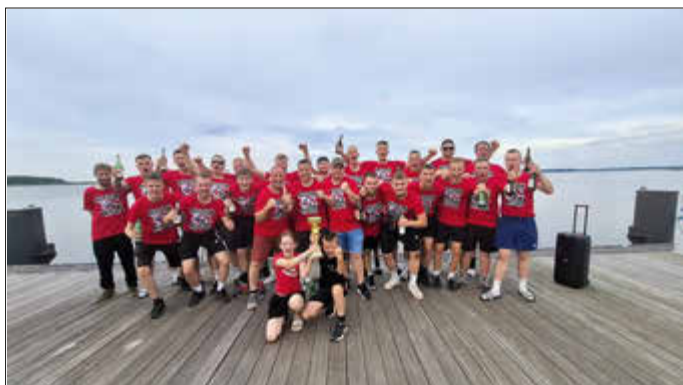
Am Lissaner Hafen bejubeln die Spieler die Meisterschaft.

Bereits in der Liga ließ der VSV der Konkurrenz kaum eine Chance. In 24 gewerteten Begegnungen feierte die Mannschaft 20 Siege. Drei weitere Partien wurden am grünen Tisch für Lissan gewertet, nachdem die gegnerischen Mannschaften nicht angetreten waren. Lediglich eine Niederlage musste das Team hinnehmen. Mit einem beeindruckenden Torverhältnis von 109:34 Treffern und einem Vorsprung von 17 Punkten auf den Tabellenzweiten Rot-Weiß Wolgast sicherte sich der VSV souverän die Meisterschaft.