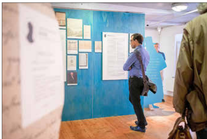
Blick in die Ausstellung 2024 in St. Spiritus Greifswald.

Einladung zur Ausstellungseröffnung am 23. Juli um 19 Uhr