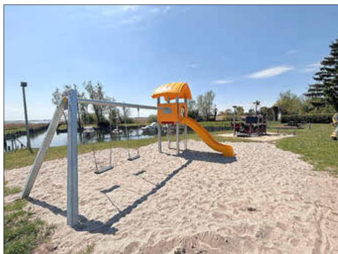
Krummin / Neeberg