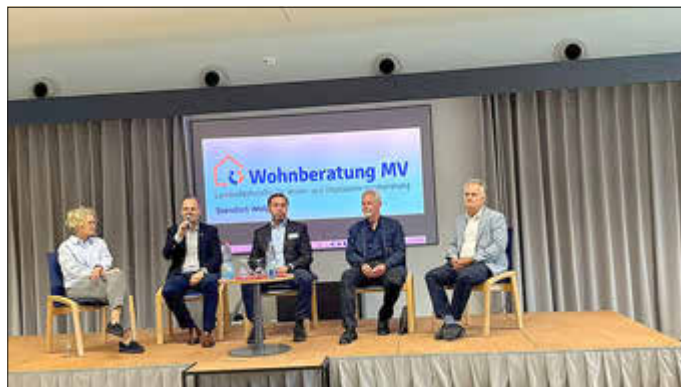
Fazit der Veranstaltung: Sehr gelungen - unbedingt Neuauflage 2027!