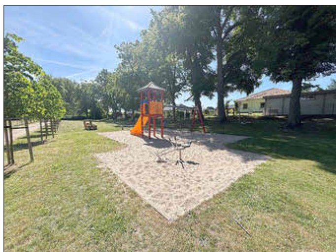
Stadt Lassan / In den Anlagen