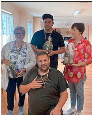
Kegelsieger im Monat Mai