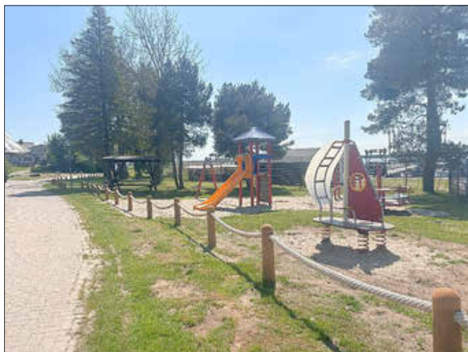
Sauzin / Ziemitz

Die Gemeinden des Amtes Am Peenestrom bedanken sich bei dem Ministerium für Klimaschutz, Landwirtschaft, ländliche Räume und Umwelt, sowie dem Staatlichen Amt für Landwirt-