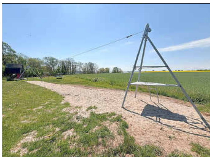
Krummin / Krummin