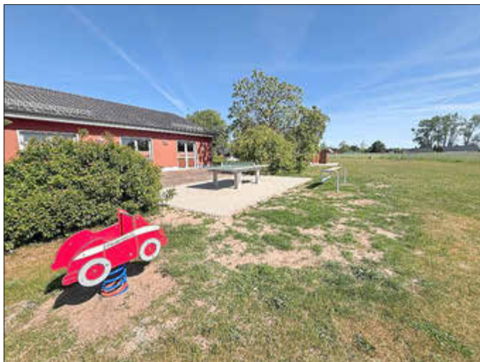
Zemitz / Am Gemeindezentrum