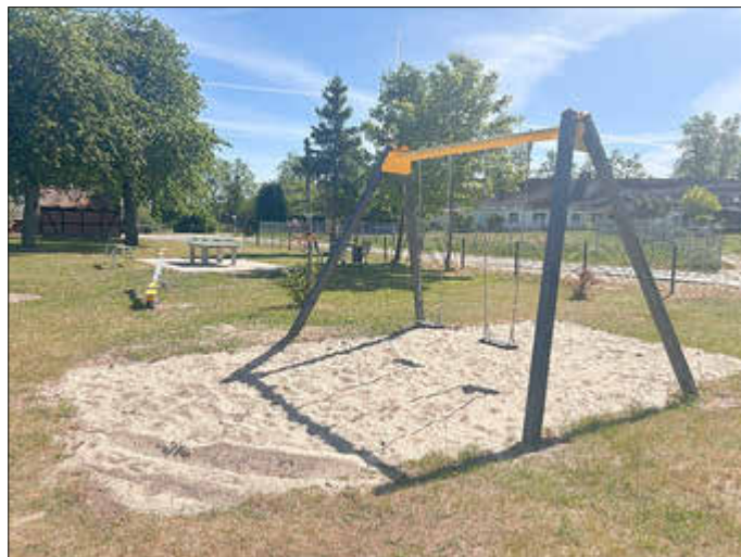
Buggenhagen / Jamitzow

teil der Gemeinde Sauzin wurde der vorhandene Spielplatz mit Fördermitteln in Höhe von 15.000 € saniert und erweitert. Die Gemeinde Zemitz hat am Gemeindezentrum und im Ortsteil Hohensee je einen neuen Spielplatz errichten lassen, insgesamt gab es 30.000 € vom Ministerium. Die entsprechenden Eigenanteile wurden je durch die Gemeinden getragen.