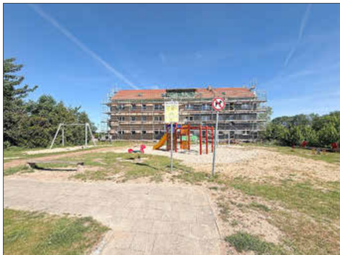
Stadt Lassan / Neustadt