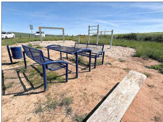
Buggenhagen / Berliner See