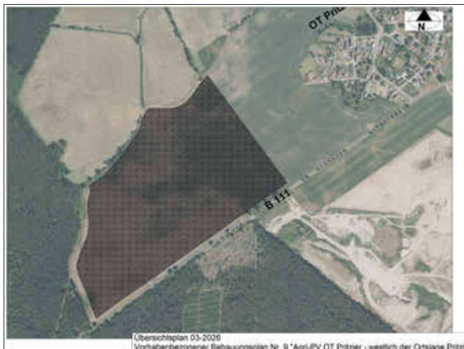
Übersichtsplan 03-2026 Vorhabenbezogener Bebauungsplan Nr. 9 „Agri-PV OT Pritzier - westlich der Ortslage Pritzier“ Übersichtsplan 03-2026 - Vorhabenbezogener Bebauungsplan Nr. 9 „Agri-PV OT Pritzier - westlich der Ortslage Pritzier“

Die nächste Ausgabe erscheint am 17. Juli 2026.