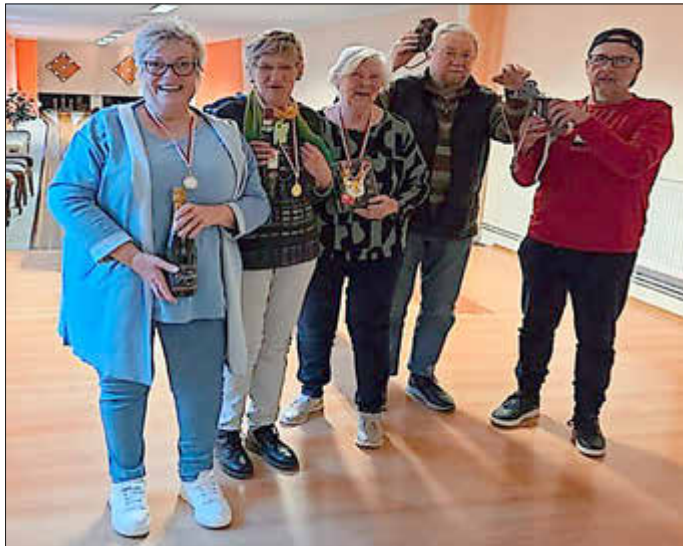
Kegelsieger im Monat April