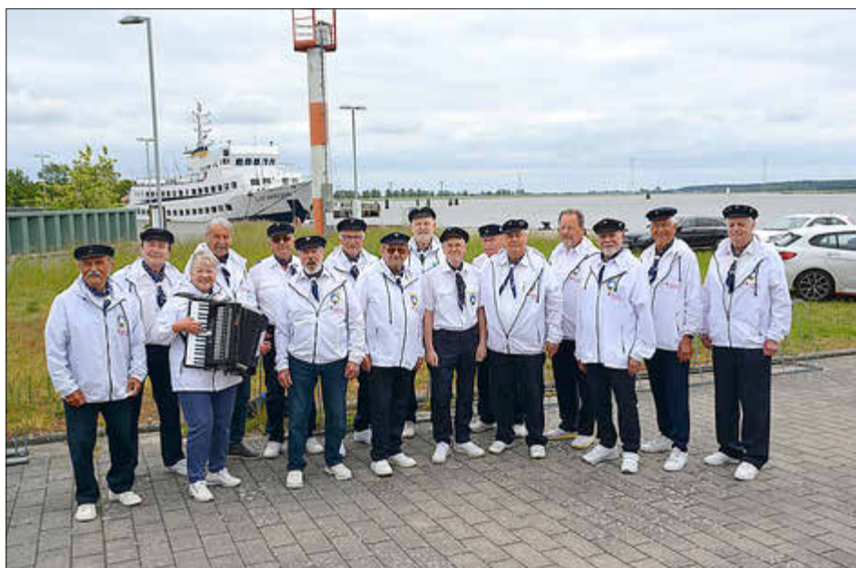
Auftritt in Peenemünde im Mai 2026