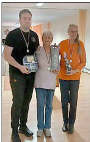
Kegelsieger im Monat März