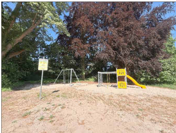
Zemitz / Hohensee

Die Gemeinden des Amtes Am Peenestrom bedanken sich bei dem Ministerium für Klimaschutz, Landwirtschaft, ländliche Räume und Umwelt, sowie dem Staatlichen Amt für Landwirt-