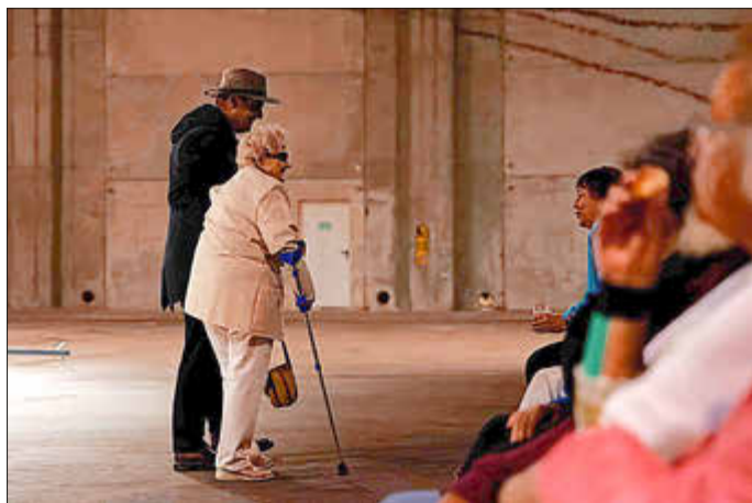
Der Bürgermeister geleitete seinen Gast persönlich zum Platz.

Die nächste Ausgabe erscheint am 6. November 2024.