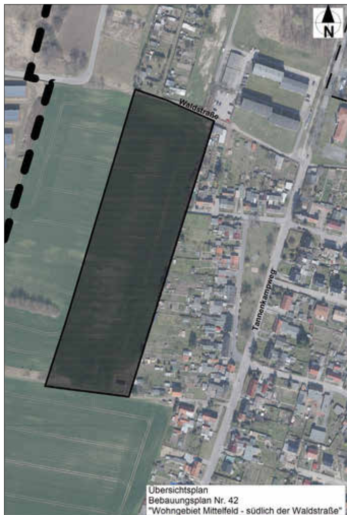
Übersichtsplan Bbauungsplan Nr. 42 „Wohngebiet Mittelfeld - südlich der Waldstraße“