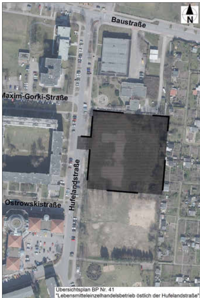
Übersichtsplan BP Nr. 41 „Lebensmitteleinzelhandelsbetrieb östlich der Hufelandstraße“