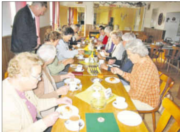
An der Kaffeetafel