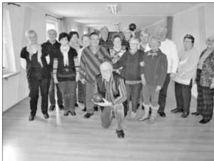
Erinnerungsfoto der Teilnehmer.

Die Senioren aus dem OT Buddenhagen fuhren mit eigenen Pkw zum Osterkegeln nach Hanshagen.